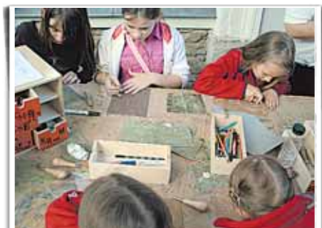
Schüler im Studienraum beim Anfertigen von Radierungen.

Carlfriedrich Claus, ein großer Sohn der Stadt